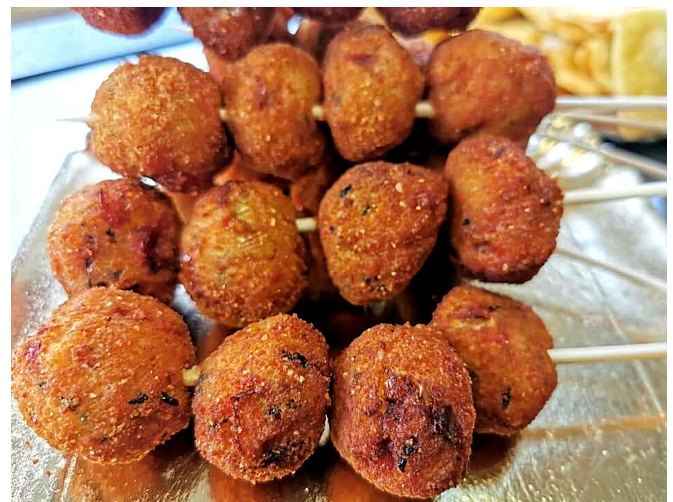
Croustilles au poulet (poulet mariné hâché aux épices enrobé d'une panure croustillante)