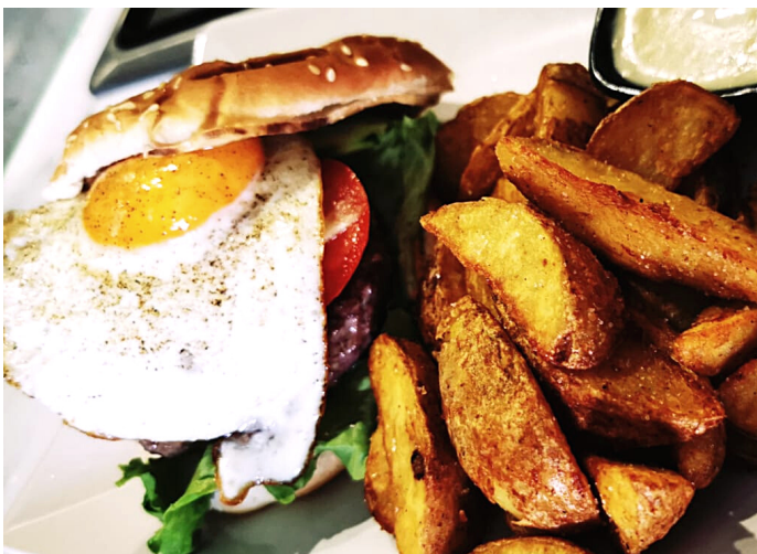
Burger guacamole, frites de patates douces et sauce au roquefort