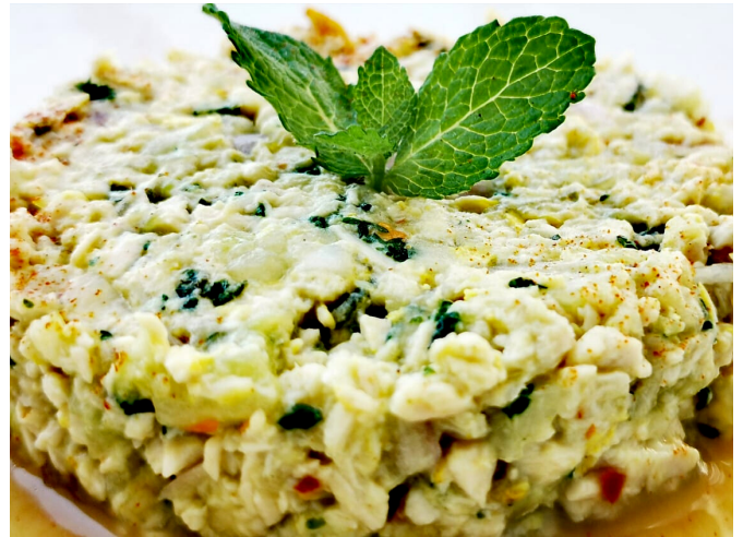
Chiquetaile de poulet ou morue. En appétit avec chouquette ail et persil ou en salade.